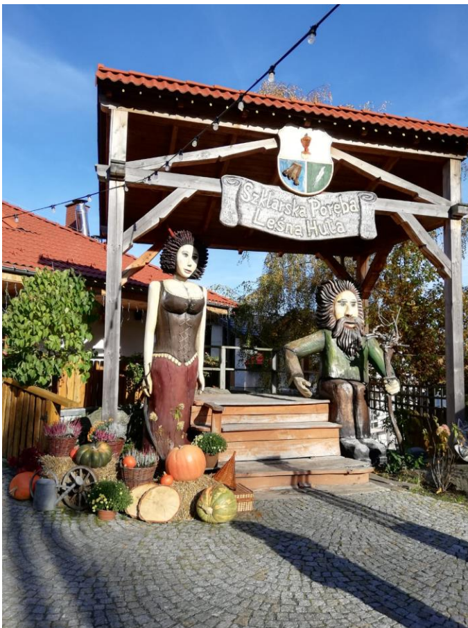
Parte a universului local – Szklarska Poręba

Aproape de final, bucuria de a lucra împreună ne-a adus pe toți la aceleași mese pentru realizarea produsului „Painting of Unity”. Elevii din fiecare țară parteneră în proiect s-au organizat în echipe mixte și au realizat colaje și desene care definesc, în viziunea lor, valorile culturale comune, dar și identitatea fiecărui popor pe care îl reprezintă.