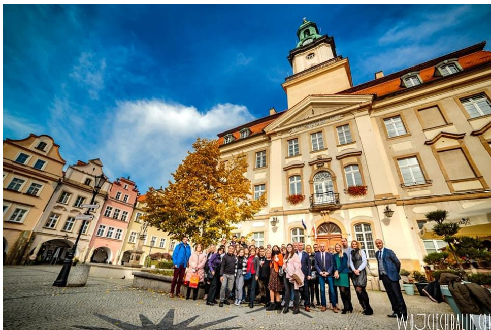
În fața Primăriei, în parcul central al orașului