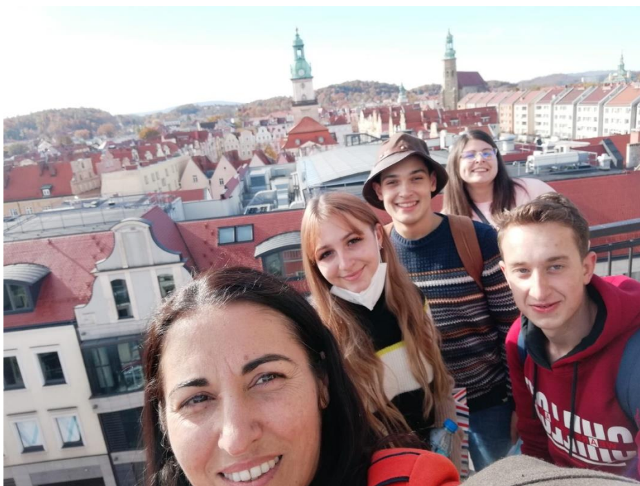
Turnul din centrul orașului ne-a amintit de locurile natale.

În programul săptămânii au fost incluse și vizite tematice care au condus la desăvârșirea cunoașterii prilejuite de realizarea produsului „We Live Here”: ne-a fost prezentată Primăria, o clădire istorică păstrătoare a valorilor comunității, am descoperit toate monumentele locale prin explorarea unui parc tematic de construcții în miniatură, adevărate mărturii ale pasiunii pentru arhitectură.