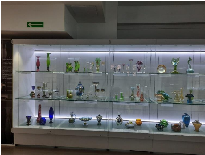
Exponate de sticlă la muzeul Karkonosze

prin exploatarea minelor din zonă au fost descoperite de-a lungul timpului diferite tipuri de minereu de siliciu (component de bază al sticlei) conținând substanțe rare (uraniu), ceea ce a făcut ca regiunea să devină renumită în acest sens.