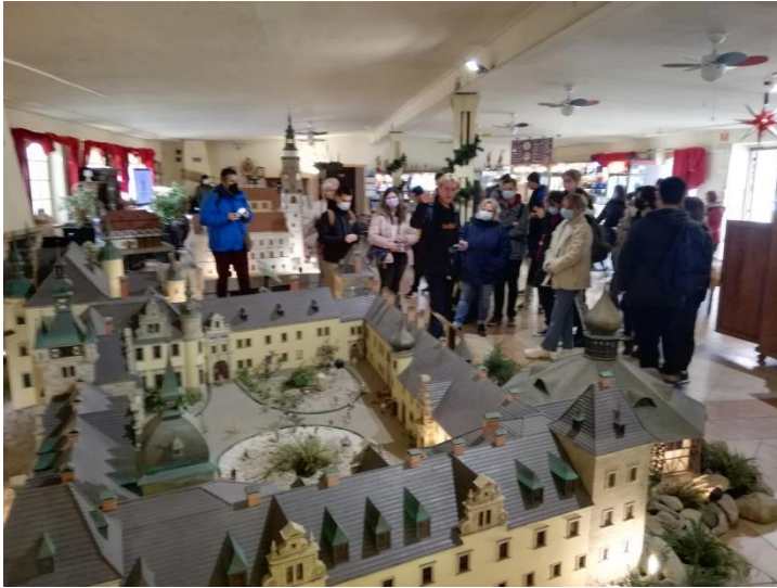
La muzeul cu miniaturi din Kowary