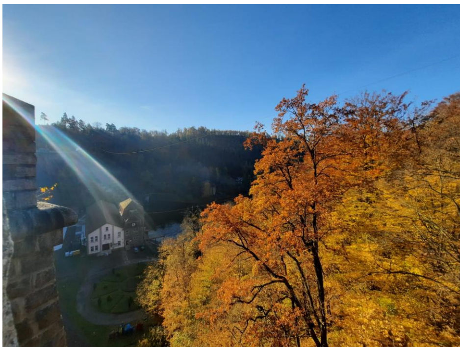
Barajul din Pilchowice

Provincia Silezia, în care se află orașul Jelenia Gora, este cunoscută pentru bogățiile din subsol, ceea ce a făcut ca zona să fie un punct strategic pe harta principalelor evenimente din trecutul istoric comun al Europei (de exemplu, cele două războaie mondiale). Deși Următoarea realizare a săptămânii a fost „Art and Intercultural Dialogue”. Pentru pregătirea activității am dat curs unor noi invitații de a descoperi valori în cadrul unor muzee amenajate în subteran, în incinta unor foste mine.