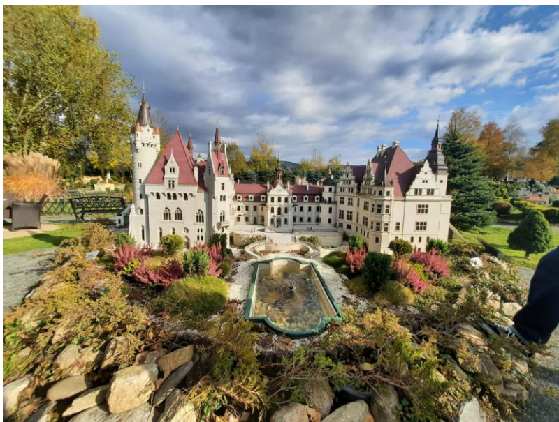
Castel din parcul muzeului miniaturilor arhitecturale din Kowary