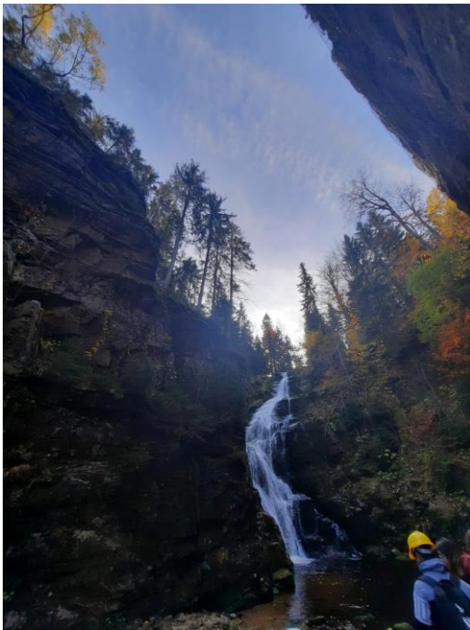
Cascada din Szklarska Poreba