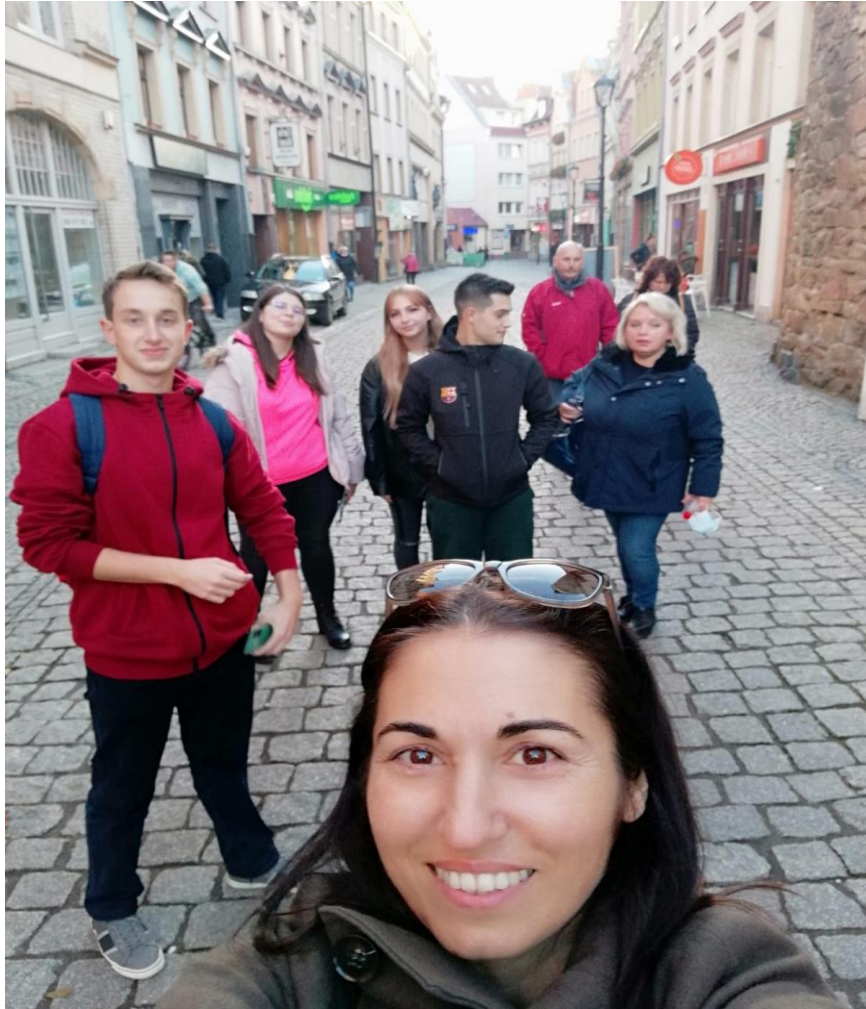
Echipa țării noastre, explorând orizontul local