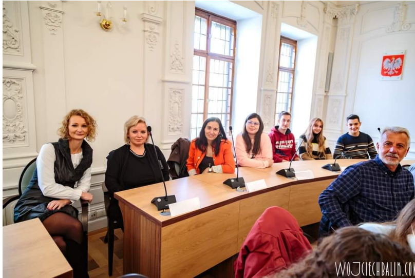
În sala de ședințe a Consiliului Local – Primăria Jelenia Gora