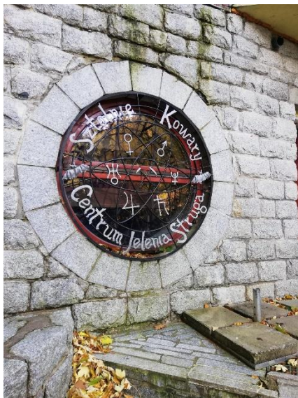
Vitraliu la intrarea în mina Kowary