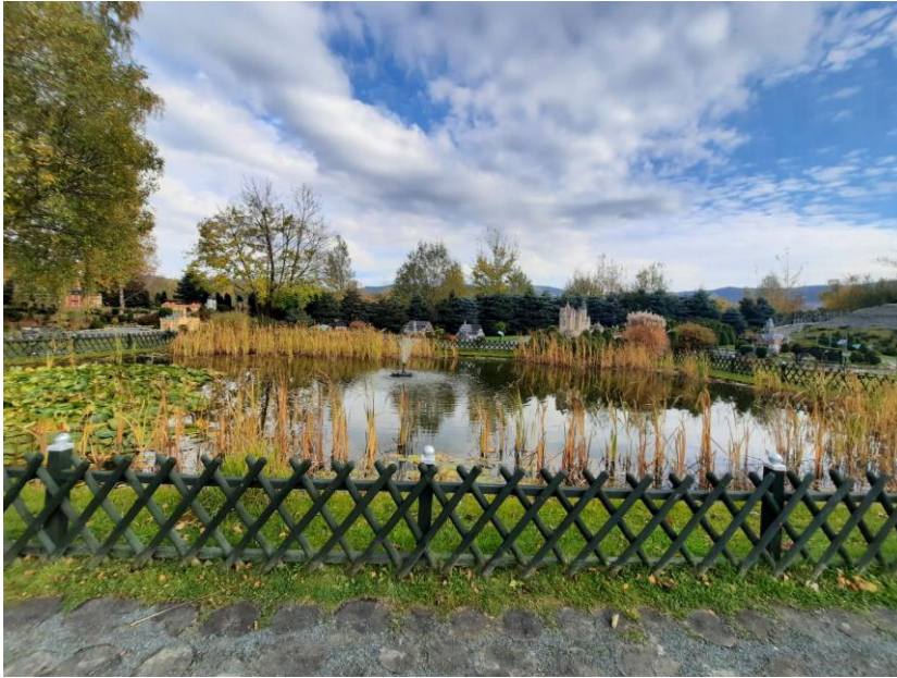
Peisaj de ”toamnă aurie”