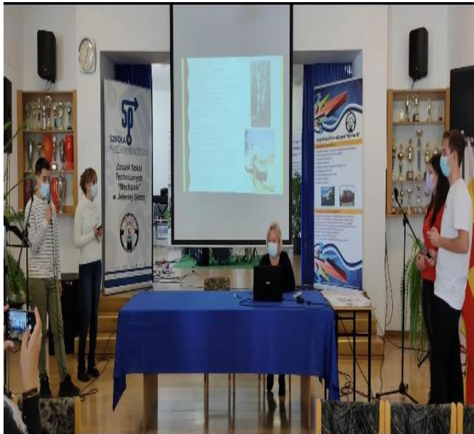
La școală, în timpul prezentării produselor finale.

Pentru produsul „We Live Here”, gazdele ne-au provocat la explorarea directă a spațiilor purtătoare de valori culturale și la descoperirea unor simboluri- mărturii ale istoriei și tradițiilor din zonă. Pe aceeași temă, cu ajutorul tehnologiei, echipa noastră și cele ale țărilor partenere au reușit să aducă din zonele natale, prin imagine, sunet și cuvânt, elemente definitorii pentru definirea spațiului natal și al patrimoniului cultural specific acestuia. Activitățile realizate în sala de conferință a școlii-gază au fost deosebit de atractive, iar bucuria tuturor de a descoperi a fost manifestată prin aplauze și zâmbete după fiecare prezentare. Acestea au fost complete de experiențele de cunoaștere prin observarea directă a orașului încărcat de istorie prin ”Vânătoarea de comori” – acțiune desfășurată pe echipe în care elevii au identificat diverse obiective culturale cu ajutorul unei aplicații de orientare turistică.